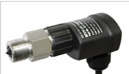
Einschraub- und Auswerteteil

Durch die Verbindung Sensor/Auswertung/potentialfreier Ausgang kann das Niveauüberwachungsgerät direkt in die Sicherheitskette eingebaut werden.