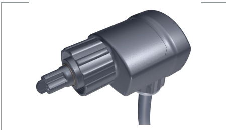
INT275 L, INT276 LC, INT277 LA, INT278 LCA

Die Geräte der Produktfamilie INT275 L - INT278 LCA werden zur Störungsfrüherkennung durch Niveauüberwachung des Kältemittels in Kälteanlagen eingesetzt. Sie schützen die Anlage beispielsweise vor Ausfall durch Überhitzung wegen Kältemittel-mangel.